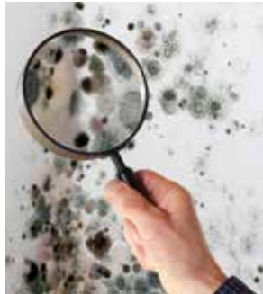
Schimmelbildung bei feuchter Raumluft

Unsere Gebäude werden energetisch immer effizienter. Durch eine Fassadendämmung und Isolierung werden die unkontrollierte Luftzirkulation und der damit verbundene Wärme- und Geldverlust auf ein Minimum reduziert. Daraus resultierend haben etwa 70 % der deutschen Haushalte ein Problem mit Schimmel. Ein Grund ist überhöhte Luftfeuchtigkeit durch mangelnden Luftaustausch. Gesundheitliche Probleme und eine angegriffene Bausubstanz sind häufig die Folgen. Abhilfe schafft eine Anlage zur kontrollierten Wohnraumlüftung.